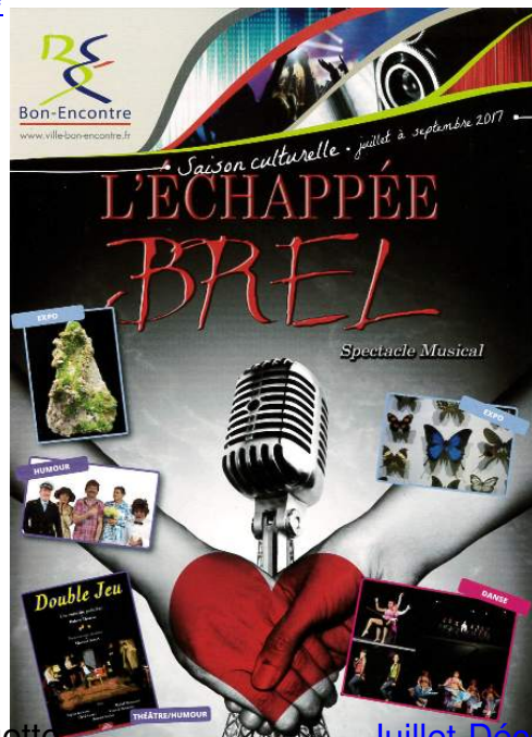
Télécharger la plaquette