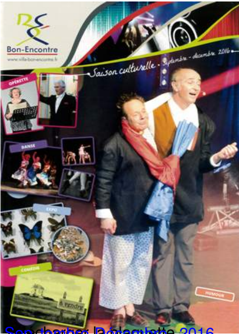
Séances d'opérette 2016