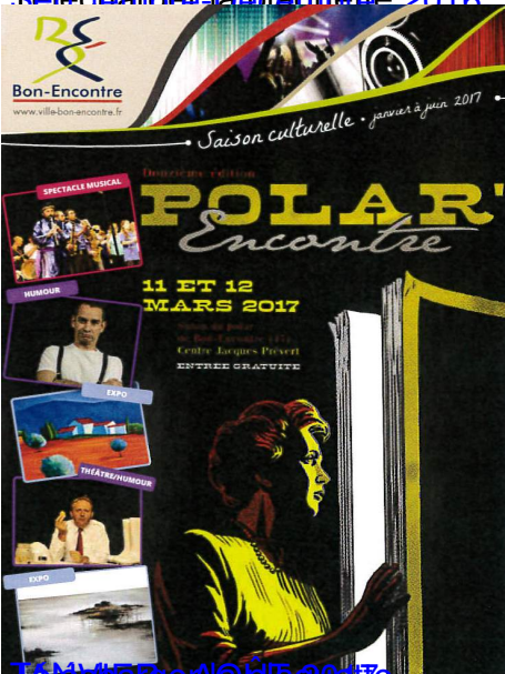
Janvier et Février 2017