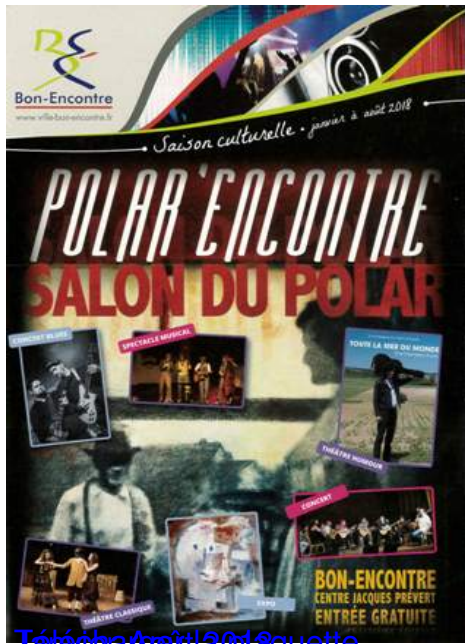
Télécharger la plaquette