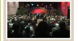
Cette année, les vœux du maire et du conseil municipal ont eu lieu au centre J. Privat. Emotions lors de l'animation musicale de la grande Salle VOUJBA, accompagnée de la chorale GLORYSPEL.