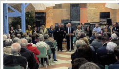
La nouvelle salle de Tortis a accueilli les vœux à la population du Maire et du Conseil Municipal.