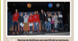
Remise de diplômes aux sportifs de la commune récompensés pour leurs résultats en 2018 (disciplines baseball, danse et rugby).