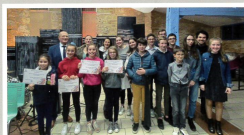
Mise à l'honneur des jeunes sportifs méritants (association Danse'n Coet club de Baseball) qui se sont distingués.