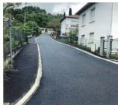
Réfection de la chaussée enrobée, Chemin du cimetière (bourg).