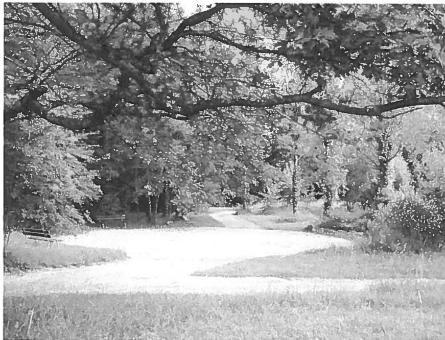
Village Vacances DAREL - Bois des Jésuites

Considérant que les communes de Pont-du-Casse et Bon Encontre sont propriétaires du site en indivision, le rapport présente un état des lieux global.