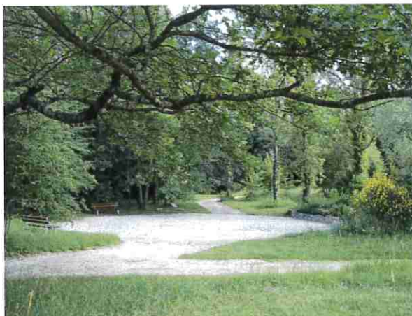
Village Vacances DAREL - Bois des Jésuites

Considérant que les communes de Pont-du-Casse et Bon Encontre sont propriétaires du site en indivision, le rapport présente un état des lieux global.