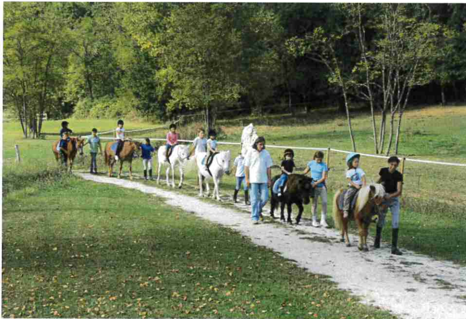
Site du SIVU de Darel - Poney Club