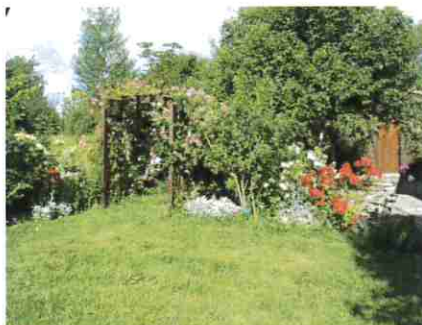
Jardin Botanique - Roseraie

Botanistes, mycologues, entomologistes, découvrent sur les deux hectares mis à la disposition par le SIVU de Bon-Encontre – Pont-du-Casse, une nature préservée.